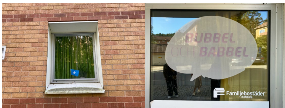
Bild på fönster från Kalendervägen 28-38.

En ny konstgestaltning ska tas fram på gångstråket som ligger på baksidan av punkthusen vid Kalendervägen 28–38 i Kortedala, Göteborg.